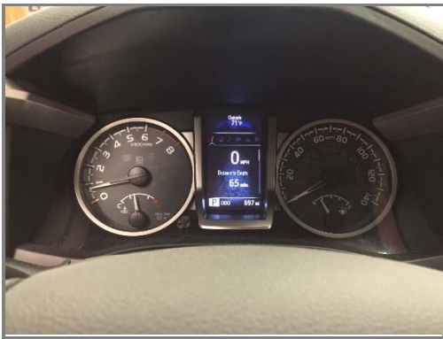
Témoin d'anomalie pas allumé

Si des DTC sont relevés après une réparation, on pourra les diagnostiquer et y remédier avant de redonner le véhicule à son propriétaire.